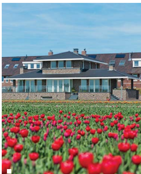
■ Horsman & co, al meer dan 120 jaar een begrip in de Duin- en Bollenstreek

Voor ons is geen klant hetzelfde. Iedereen heeft zijn eigen wensen en behoeftes en wil zijn leefomgeving persoonlijk invullen. Geen standaardoplossingen, maar maatwerk. Wij begrijpen dat en gaan samen met u op zoek naar úw thuis of die ene prettige werkomgeving. Wij denken met u mee, en vervolgens denken wij verder. Hoe kunnen wij uw wensen handen en voeten geven? Daarin gaan wij ver, we zijn pas tevreden als u dat bent.