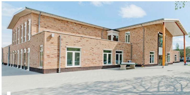
■ Project: Mossenest (boven) Renovatie museum De Zwarte Tulp (onder)