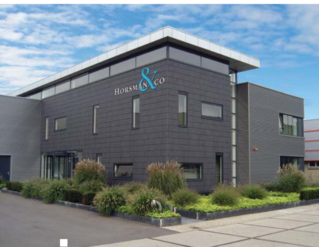
■ De 2 e Poellaan 12 in Lisse

Horsman & co is een begrip in de Duin- en Bollenstreek en ook steeds meer daarbuiten. Het hart van de Randstad, daar zijn we vertrouwd.